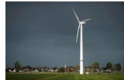
Windturbine buiten kern

10. De nodige extra elektriciteit komt met prioriteit uit zonnepanelen op daken van huizen, bedrijven en stallen . En het platform start 'n brede dialoog voor 1 grote dorpswindturbine en 1 buurtbatterij .